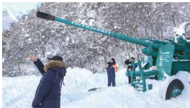
Для спуска лавин используются зенитные орудия

— Чтобы защитить население и территории от возможных последствий схода