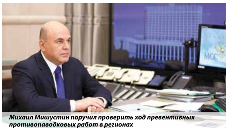
Михаил Мишустин поручил проверить ход превентивных противоаварийных работ в регионах