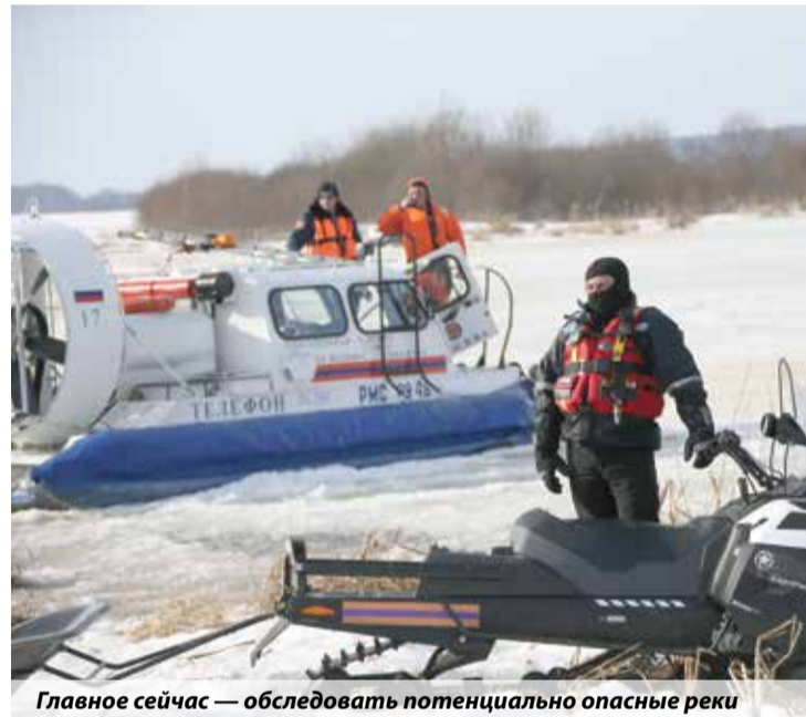
Главное сейчас — обследовать потенциально опасные реки