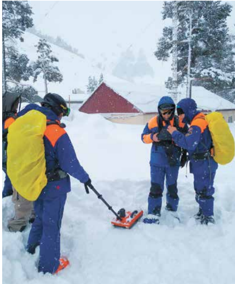
Спасатели Эльбрусского высокогорного ПСО проводят испытания прибора «Поиск-ПЛ»

В основе действия «Поиска-ПЛ» — метод подповерхностной радиолокации сверхширокополосным сигналом. Он обеспечивает высокую достоверность поиска на глубине до 5 м. Во время обследования территории спасатели получают на планшете радиоизображение структуры снежного покрова, которое дает информацию о том, нет ли под снегом пострадавших. На обследование участка пло-