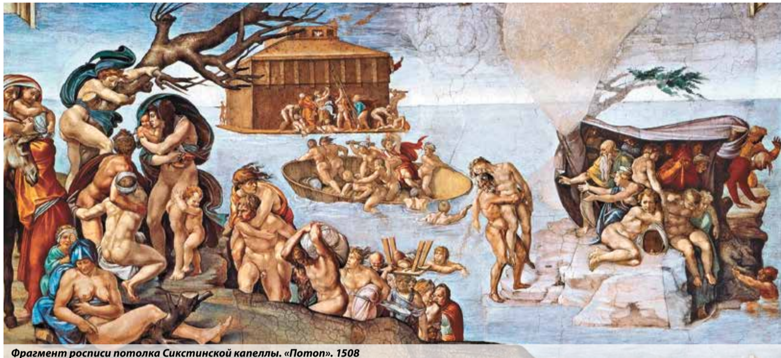
Фрагмент росписи потолка Сикстинской капеллы. «Потоп». 1508

кратно ходил туда, чтобы изучать роспись свода в отсутствие Микеланджело. Впечатлившись увиденным, Рафаэль решил закрасить уже законченную им фреску в церкви Сант-Агостино и написать ее заново. Более того, во фреске «Афинская школа», украшающей Ватиканский дворец и изображающей великих фи-