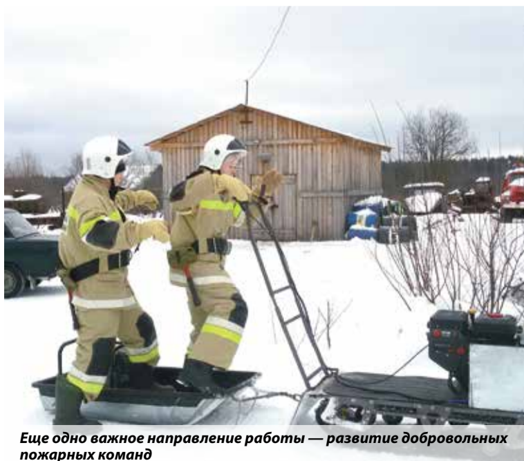
Еще одно важное направление работы — развитие добровольных пожарных команд

Второе — регулярно проводить сбор, обобщение и распространение положительного опыта работы добровольцев, разрабатывать методические материалы и рекомендации по созданию и функционированию общест-