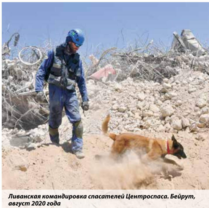
Ливанская командировка спасателей Центроспаса. Бейрут, август 2020 года

ки МЧС начали эвакуацию тел заложников, но внезапно раздался сильный взрыв и боевики открыли по спасателям огонь. Пришедшие на Быковское кладбище спасатели почтили память погибших минутой молчания и возложили венки на их могилы.