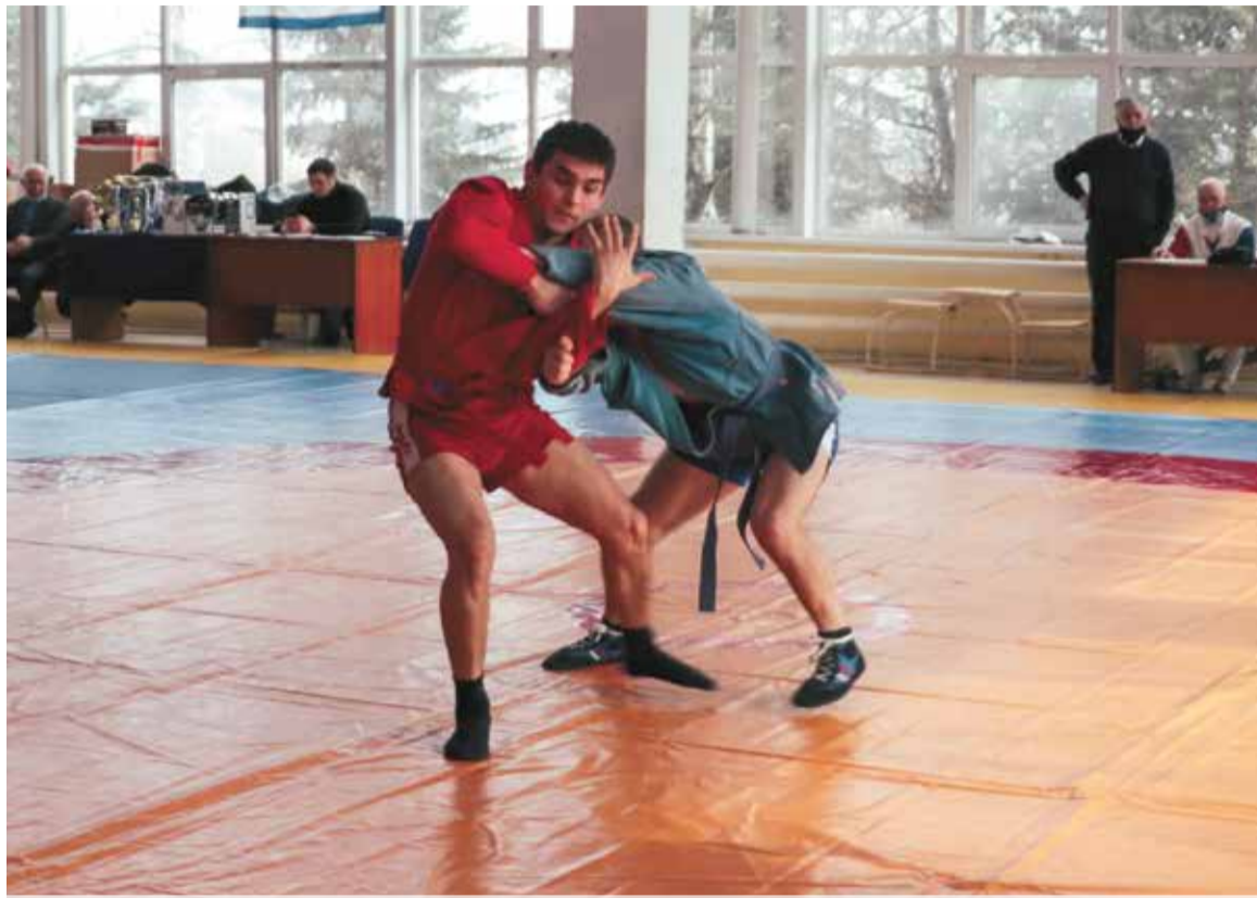
Команда МЧС России завоевала первое место среди брянских динамовцев

Участники состязались в семи весовых категориях: 62, 68,