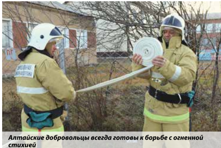
Алтайские добровольцы всегда готовы к борьбе с огненной стихией

Сейчас на территории Алтайского края действуют 934 подразделения добровольцев. Чтобы поддержать деятельность волонтеров и стимулировать развитие добровольческого движения, было принято решение привлечь к этой работе социально ориентированные некоммерческие организации (СОНКО). Предполагается, что они будут участвовать в конкурсных отборах на получение губернаторских, президентских грантов и разного рода субсидий, в том числе от МЧС России. В разработке и составлении программы на получение грантов будет оказывать помощь Ресурсный центр развития гражданских инициатив и поддержки социально ориентированных некоммерческих организаций Алтайского края. С помощью полученных средств СОНКО могут осуществлять выплаты добровольцам, приобретать необходимое по-