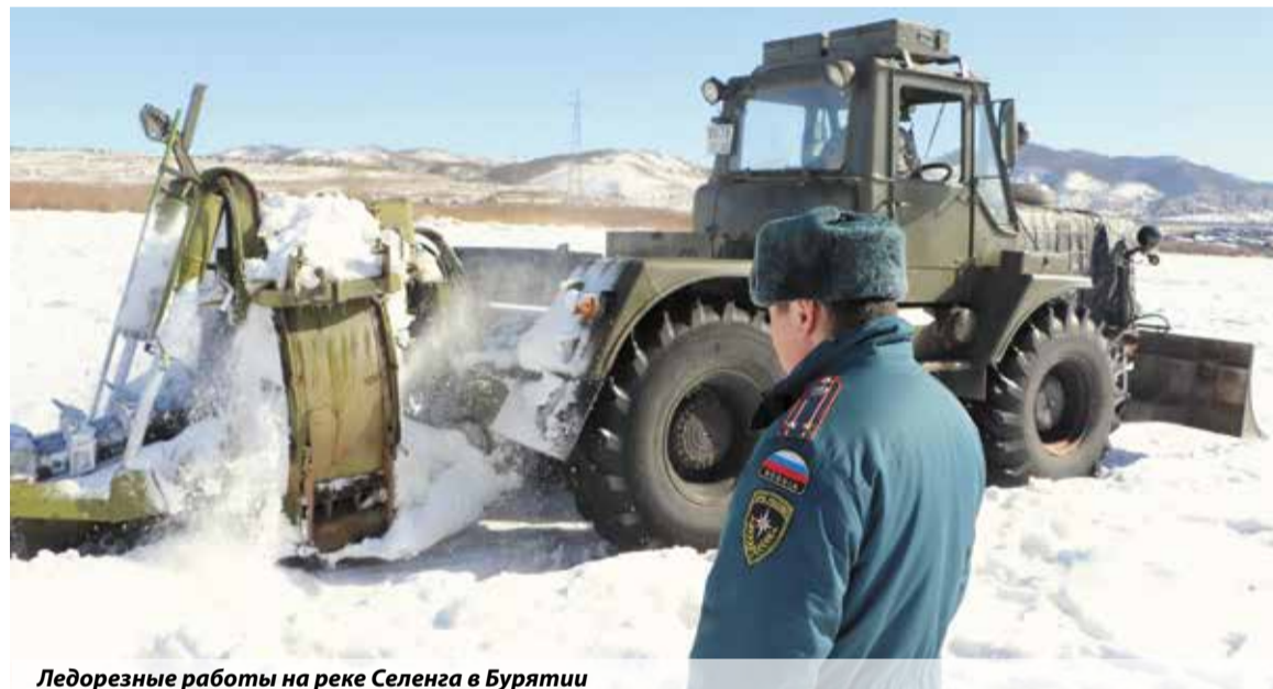
Ледорезные работы на реке Селенга в Бурятии

Дмитрий Рассказов, по материалам региональных пресс-служб