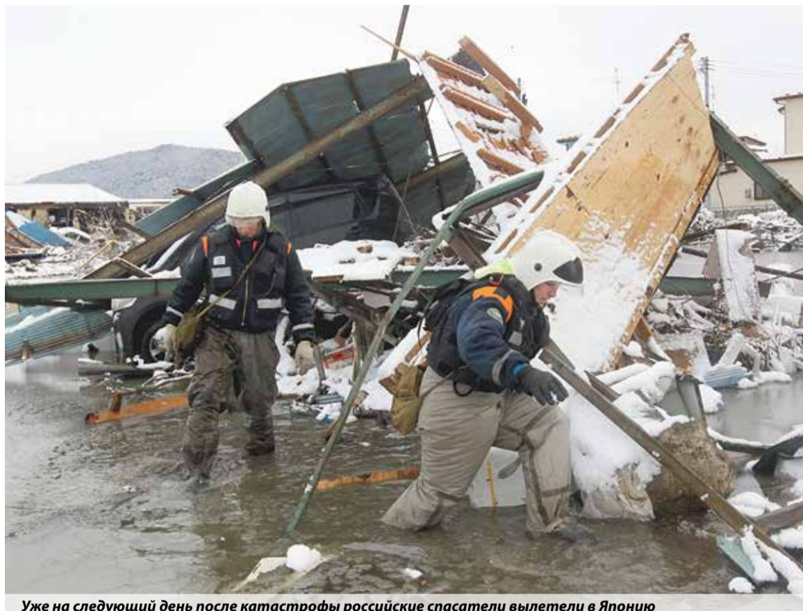
Уже на следующий день после катастрофы российские спасатели вылетели в Японию

Хотя здание АЭС успешно выдержало землетрясение, на станции, тем не менее, возникла аварийная ситуация. Из-за подземных толчков рухнули вышки ЛЭП, питавшей двигатели насосов системы охлаждения. Проектировщики допускали подобный сценарий и оборудовали станцию ава-