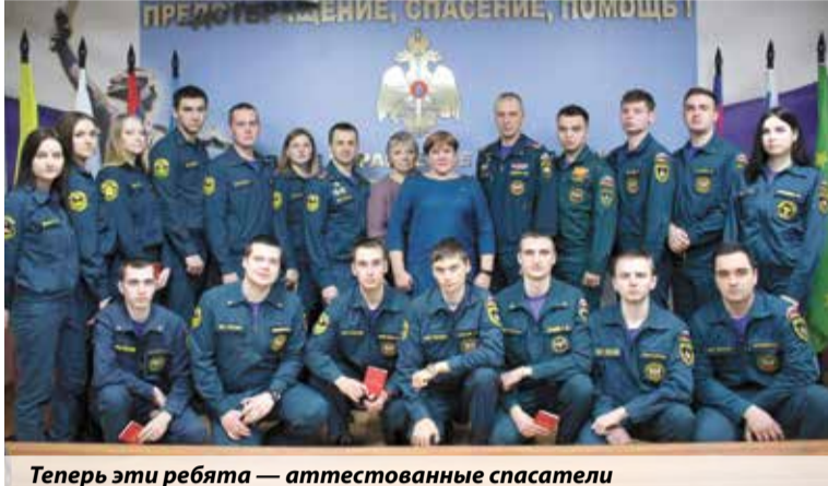
Теперь эти ребята — аттестованные спасатели

Студентам-добровольцам волгоградской учебной пожарной части вручили книжки спасателя.