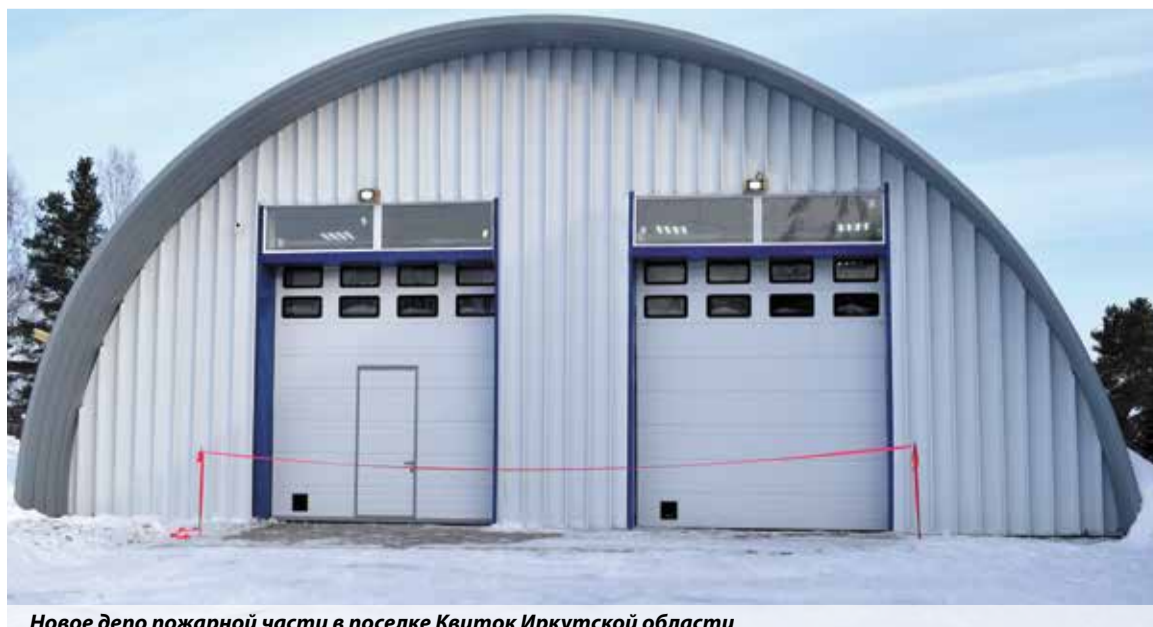
Новое депо пожарной части в поселке Квиток Иркутской области

Светлана Канина, пресс-служба ГУ МЧС России по Иркутской области