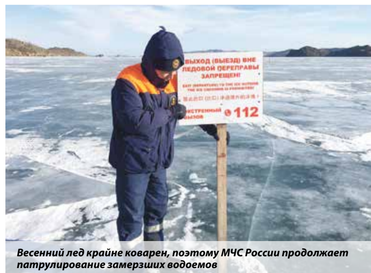
Весенний лед крайне коварен, поэтому МЧС России продолжает патрулирование замерзших водоемов